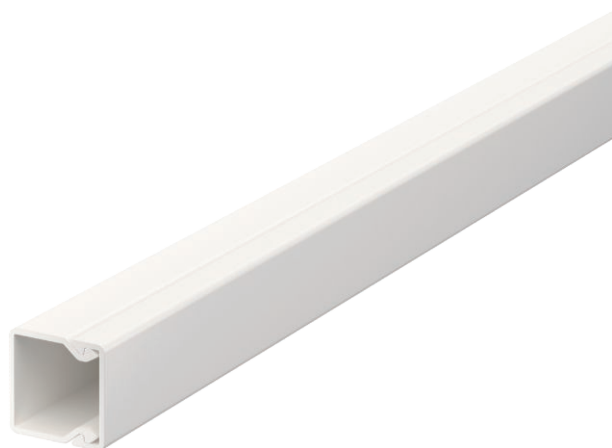
Kanaloberteil und -unterteil mit Bodenlochung.