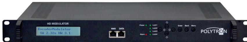
Vorderseite / Front